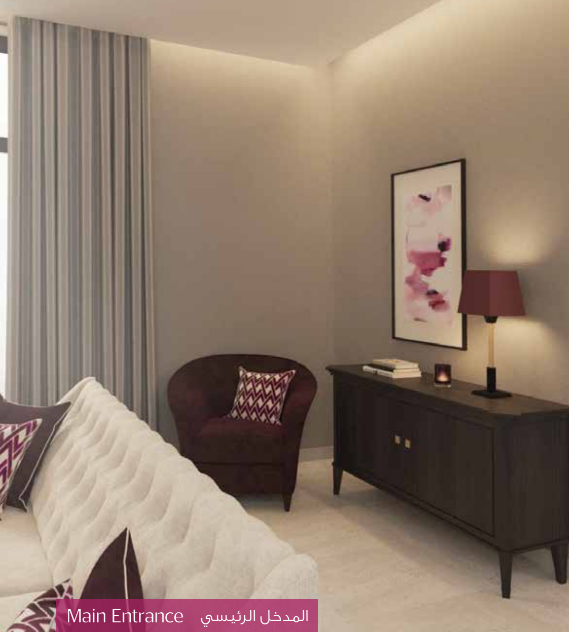
Main Entrance المدخل الرئيسي