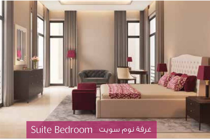
Suite Bedroom غرفة نوم سويت