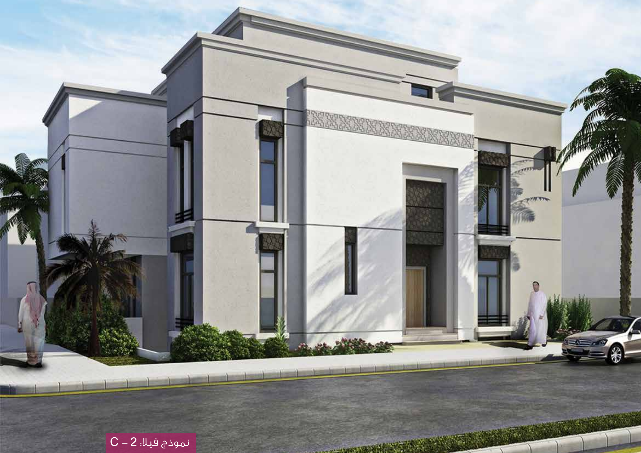
نموذج فيلا: 2 - C