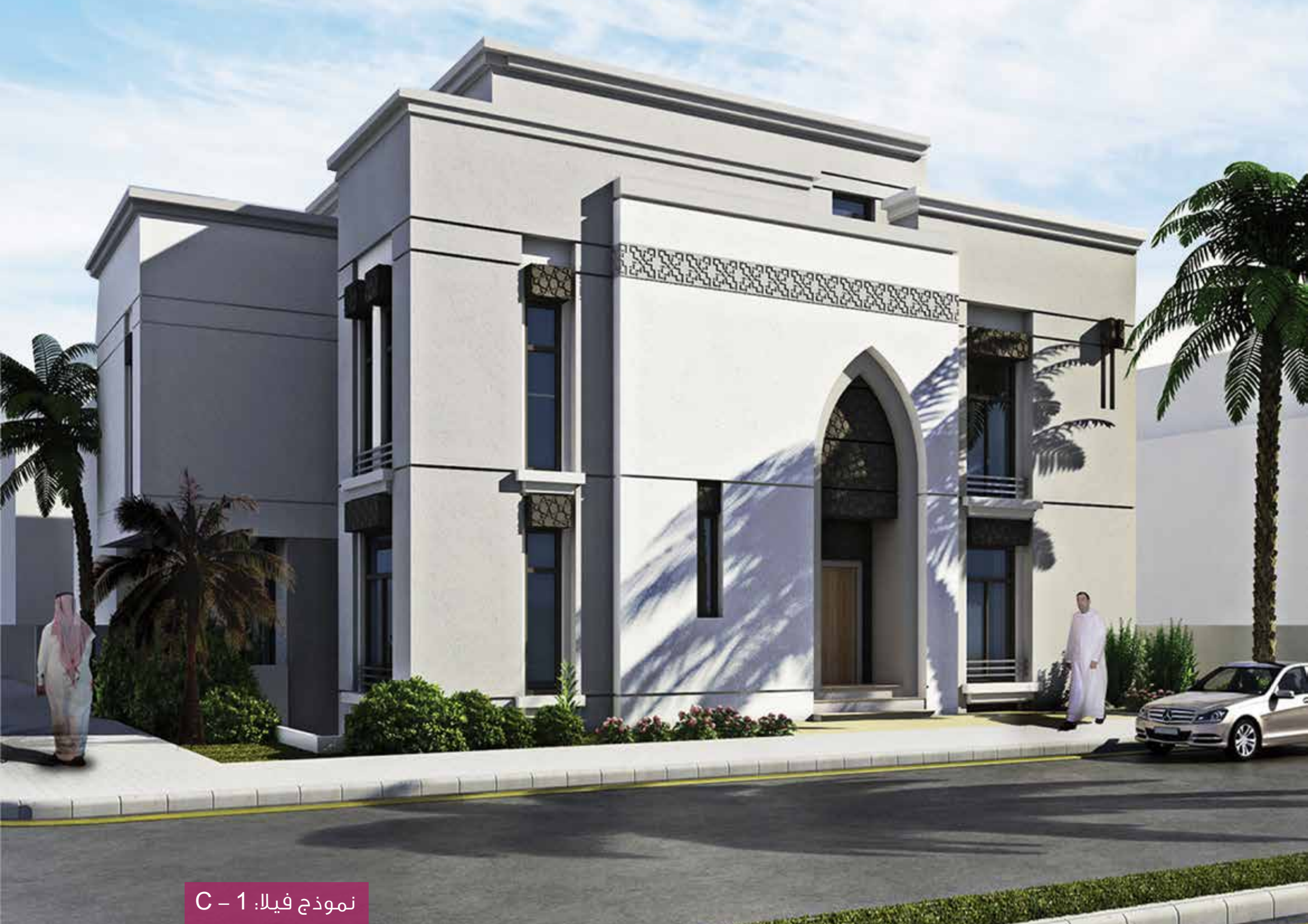
نموذج فيلا: 1 - C