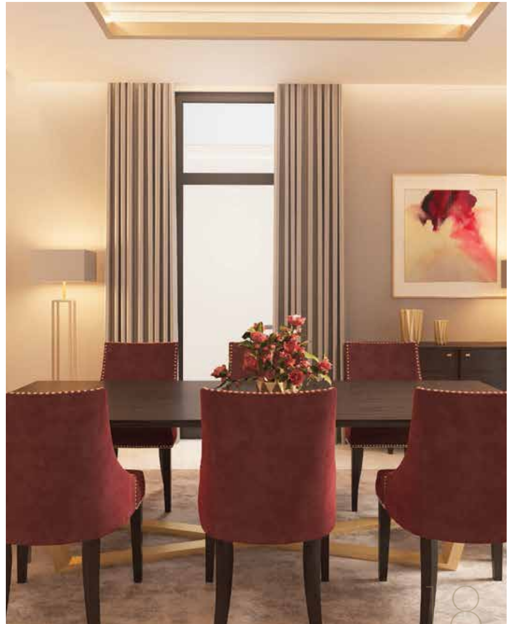
Dining Room غرفة الطعام