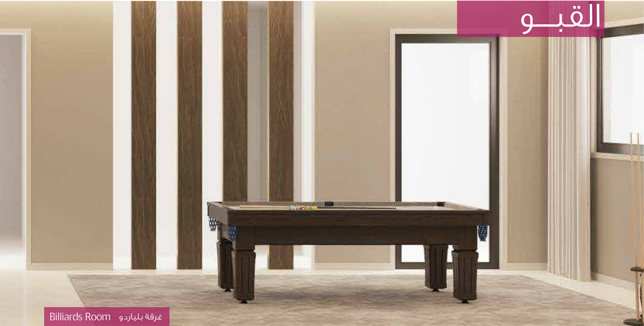
Billiards Room غرفة بلياردو