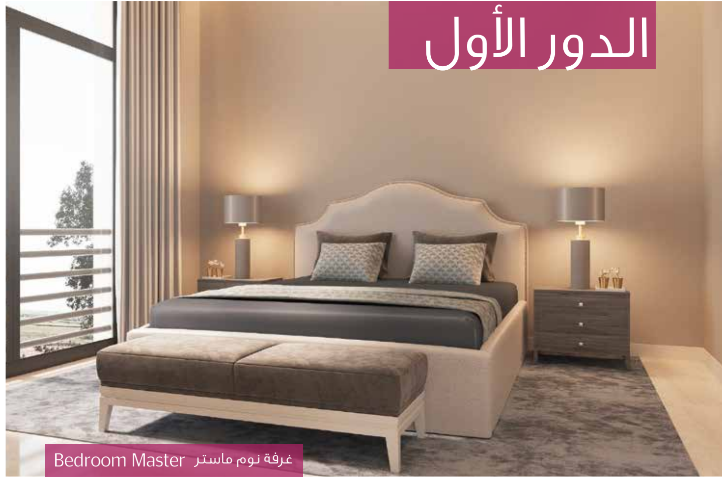
Bedroom Master غرفة نوم ماستر