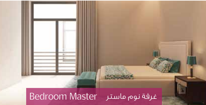
Bedroom Master غرفة نوم ماستر