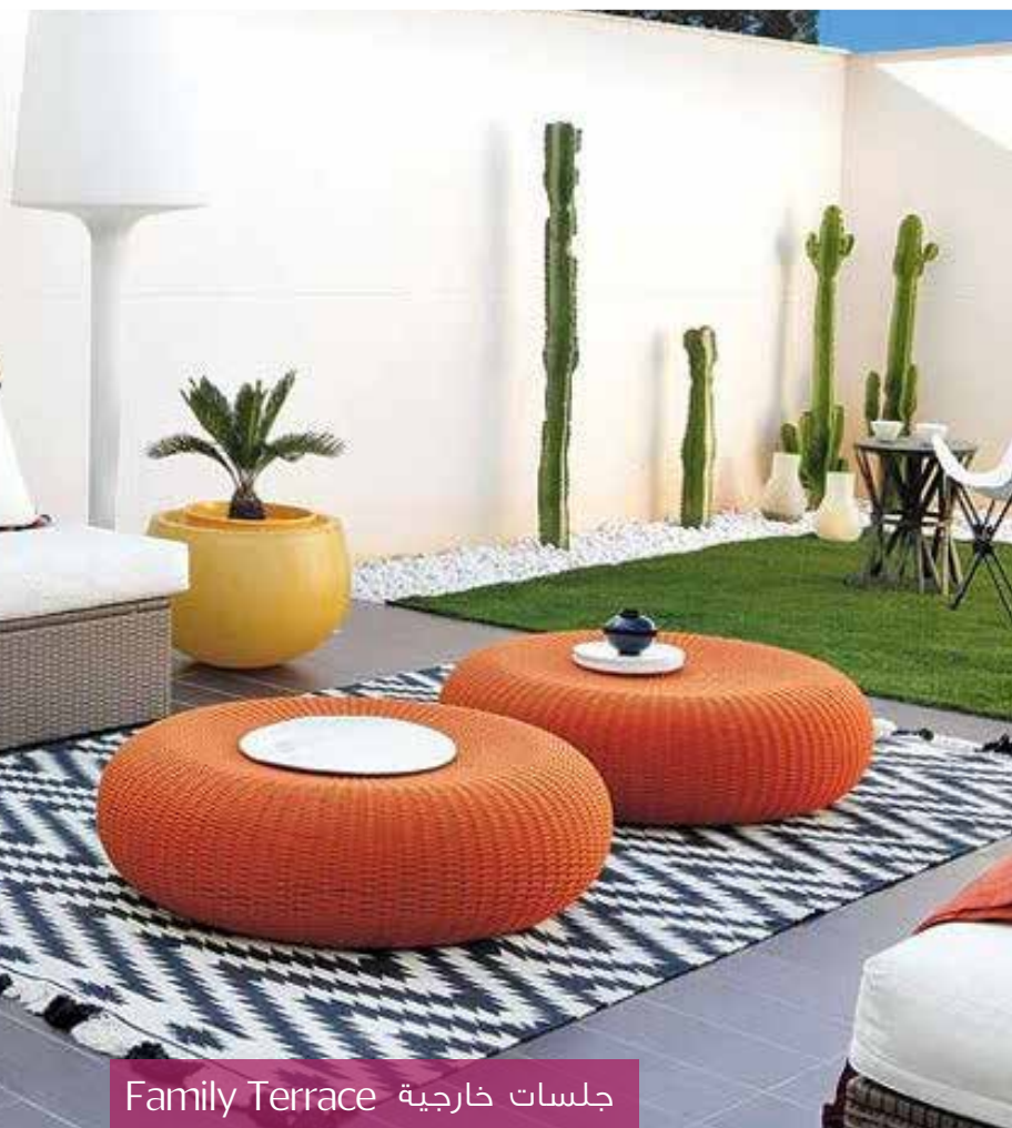
جلسات خارجية Family Terrace