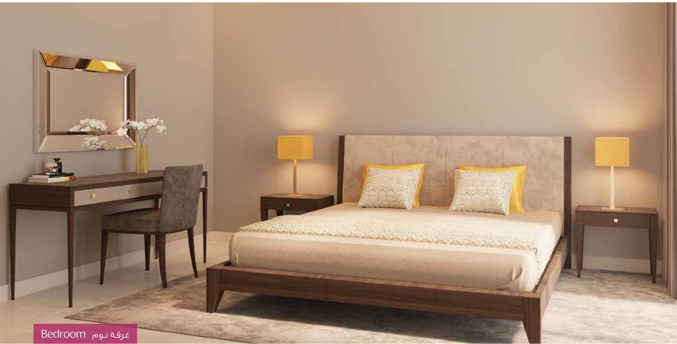
غرفة نوم Bedroom